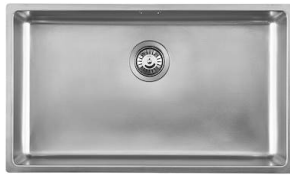
水槽 KE - R15 Vintage